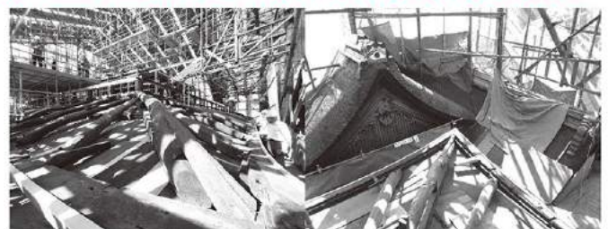
妙法院 国宝 庫裏修理工事現場

今回は、京都市東山区・妙法院 国宝庫裏修理工事現場で、庫裏(国宝)は1595年頃の建築である。本瓦葺入母屋造であり、庫裏の内部は土間・板間・座敷に分妙法院にある桃山時代建築の国宝建造物で、小屋組が今回見ることができました。また、八坂神社本殿の公開に合わせて見学いたしました。